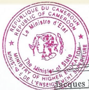
Jacques FAME NDONGO, The Minister of State, Minister of Higher Education

Article 7: The Director of Academic Accreditations and Quality, the Rector of the University of Yaounde II and the Director of IRIC shall each be responsible for the execution of this decision, which shall be registered and communicated in French and English wherever necessary.