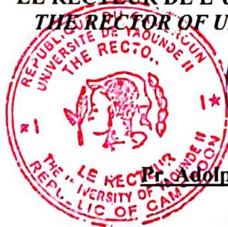
Pr. Adolphe MINKOA SHE

LE RECTEUR DE L'UNIVERSITE DE YAOUNDE II THE RECTOR OF UNIVERSITY OF YAOUNDE II